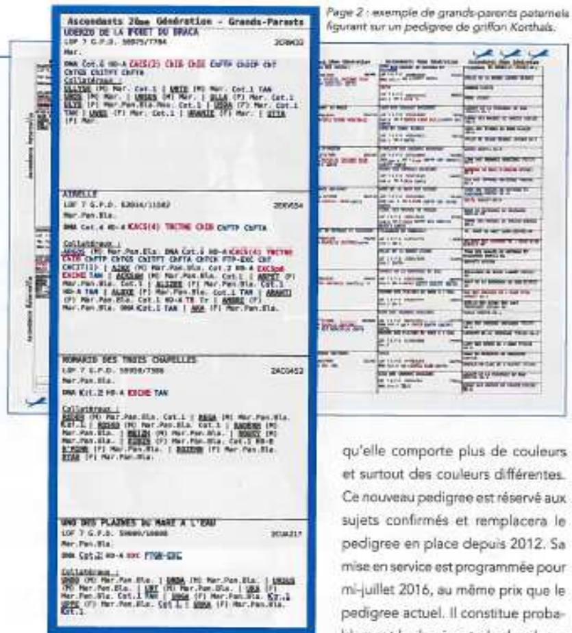
Page 2 : exemple de grands-parents paternels figurant sur un pedigree de griffon Korhaïs.

Si l'on considère maintenant les pages 2 et 3 qui comportent l'ensemble de la généalogie du pedigree, les codes couleur adoptés permettent au premier regard d'avoir une idée