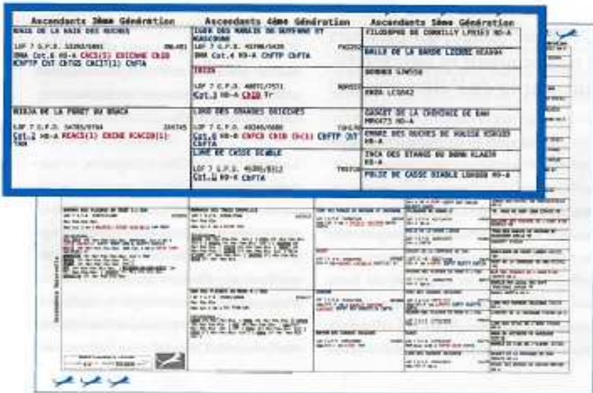
Page 3 : exemple de 3 e , 4 e et 5 e générations maternelles figurant sur un pedigree de griffon Korhaïs.

qu'elle comporte plus de couleurs et surtout des couleurs différentes. Ce nouveau pedigree est réservé aux sujets confirmés et remplacera le pedigree en place depuis 2012. Sa mise en service est programmée pour mi-juillet 2016, au même prix que le pedigree actuel. Il constitue probablement le dernier stade des documents généalogiques « papier ». Le projet d'aide à l'élevage sur lequel nous travaillons maintenant est basé sur la possibilité pour les éleveurs et les clubs de race d'avoir accès, en complément des pedigrees, à des informations beaucoup plus riches et beaucoup plus complètes en utilisant le web qui offre des possibilités nettement plus larges que le papier. ■